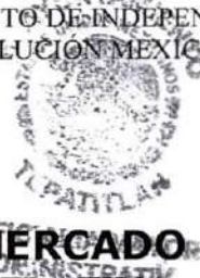
L.A.F. ERNESTO CRUZ MERCADO OFICIAL MAYOR ADMINISTRATIVA

"2010, AÑO DEL BICENTENARIO DEL INICIO DEL MOVIMIENTO DE INDEPENDENCIA NACIONAL Y DEL CENTENARIO DEL INICIO DE LA REVOLUCIÓN MEXICANA".